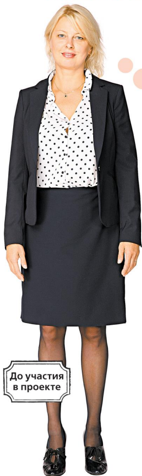
До участия в проекте

Мы продолжаем рубрику чудесных преображений, выполненных стилистами международного учебного центра Bogomolov' Image School. В разных городах и странах они помогают людям найти свой стиль и выразить индивидуальность.