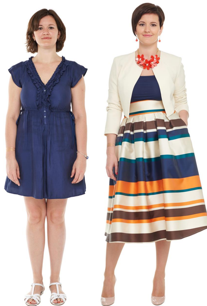
ИМИДЖ-ДИЗАЙН ОЛЬГА СЕДОВА, АННА ИВАННИКОВА (BOGOMOLOV IMAGE SCHOOL RUSSIA, МОСКВА) ПРИЧЕСКА И МАКИЯЖ АННА ИВАННИКОВА (САЛОН GL STUDIO, ПОДОЛЬСК) РУКОВОДИТЕЛЬ РАБОТЫ ЭЛИТА ХОМИЦКА (РИГА) ОДЕЖДА И АКСЕССУАРЫ МОТВИ, INTIMISSIMI, DIVA, GIORGIO ARMANI, ANNA SHU, ТЦ «НОВЫЙ КОЛИЗЕЙ», ТРЦ «ЕВРОПЕЙСКИЙ», ТДК «ТРОЙКА», ТД ЦУМ (МОСКВА)