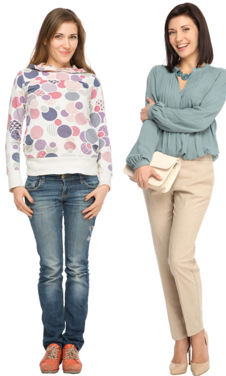
ИМИДЖ-ДИЗАЙН НАТАЛЬЯ БАРАНОВА, МАША МОРЕВА (BOGOMOLOV IMAGE SCHOOL RUSSIA, РОСТОВ-НА-ДОНУ) ПРИЧЕСКА И МАКИЯЖ НАТАЛЬЯ БАРАНОВА МАНИКЮР АСЯ ТРЕЙГУТ ФОТО ИВАН КОСЬМИНИН (СТУДИЯ ALASKA, РОСТОВ-НА-ДОНУ) РУКОВОДИТЕЛЬ РАБОТЫ ЭЛГА ХОМИЦКА (РИГА) ОДЕЖДА И АКСЕССУАРЫ MANGO, ТРЦ «ГОРИЗОНТ» (РОСТОВ-НА-ДОНУ) ПАРТНЕР ПРОЕКТА АКАДЕМИЯ «ИНДУСТРИЯ КРАСОТЫ» (РОСТОВ-НА-ДОНУ)