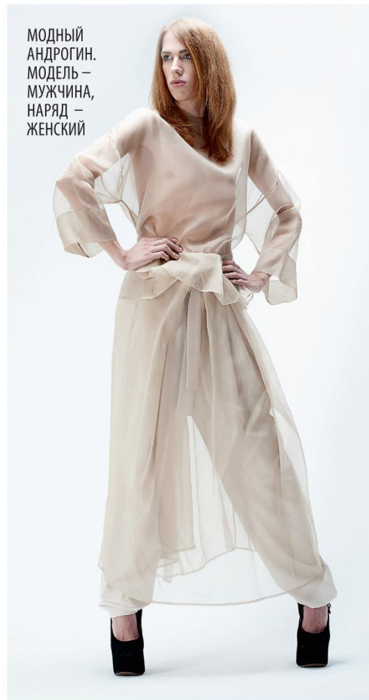
МОДНЫЙ АНДРОГИН. МОДЕЛЬ – МУЖЧИНА, НАРЯД – ЖЕНСКИЙ

Тайны во взаимоотношениях полов больше нет. Мальчики знают из телепередач и рекламы, как женщины удаляют лишние волосы на теле, какие усилия прикладывают для того, чтобы быть более привлекательными. Предбрачные ухаживания существуют исключительно в виде официального ритуала – познакомились, два года жили вместе, решили пожениться. Тут вам и кольца, и помолвка, и статус