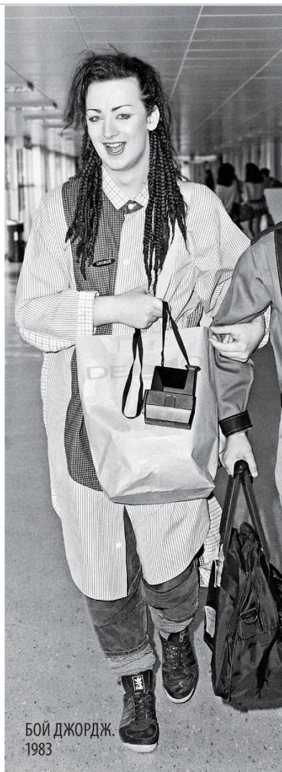
БОЙ ДЖОРДЖ. 1983

Сексуальные отношения в обществе меняются. Романтическое напряжение спадает, потому что одинаково