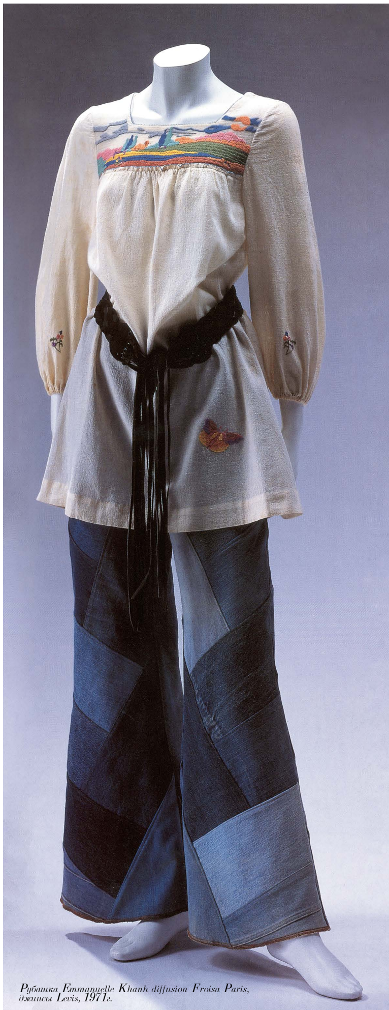
Рубашка Emmanuelle Khanh diffusion Froisa Paris, джинсы Levi's, 1971г.