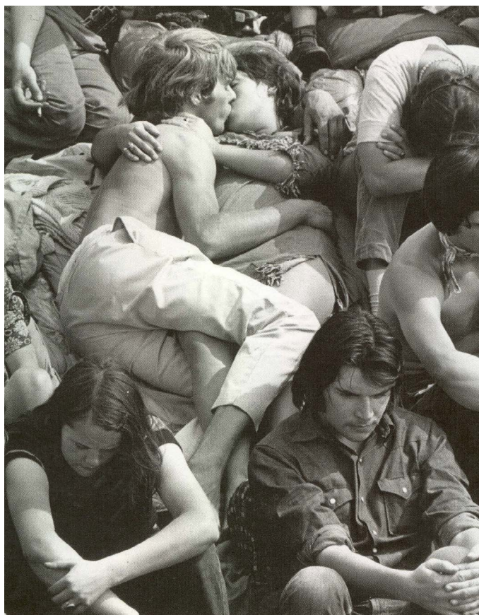
Любовь на фестивале «Isle of Wight Pop Festival», август 1970. Более 600 тысяч человек посетило этот фестиваль.