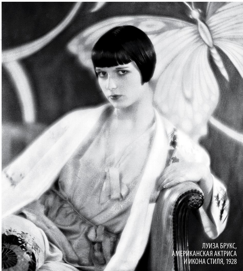
ЛУИЗА БРУКС, АМЕРИКАНСКАЯ АКТРИСА И ИКОНА СТИЛЯ, 1928

И тем не менее это так. Она коротко стрижется и резко молодеет. 45-летняя Шанель с короткой стрижкой в платье геометрической формы выглядит совсем юной. Девушка 1920-х не хочет взрослеть, не думает о детях, о будущем. Она как ребенок, которому долго не давали сладкого, а он вдруг дорвался и сожрал всю коробку. Она читает Фицджеральда, курит и водит автомобиль. Она играет в теннис. Она идет работать, и не потому, что ей не хватает денег, а потому что это модно: быть независимой и не опираться на мужское плечо. Модный танец чарльстон – чуть ли не первый в истории, когда даме не требуется поддержка кавалера. Она сама прочно стоит на ногах.