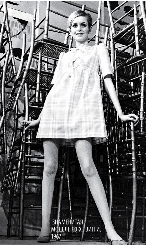
ЗНАМЕНИТАЯ МОДЕЛЬ 60-Х ТВИГГИ, 1967

участникам ЛСД с благороднейшей целью: препарат подавит агрессивность, подарит радость и войн не будет. И огромное количество его последователей искренне верили, что таким образом удастся создать рай на земле. Ах, как это по-детски: «Мама, дай таблетку для счастья!»