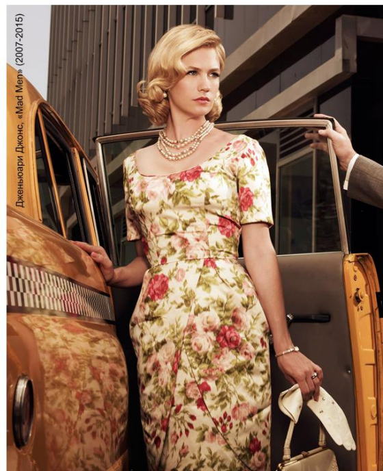
Дженьюари Джонс, «Mad Men» (2007-2015)