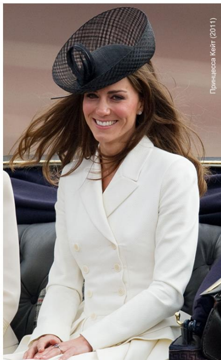
Принцесса Кейт (2011)

Еще большее влияние на модную тенденцию ladylike оказал имидж актрисы Дженьюари Джонс, сыгравшей роль Бетти Дрейпер в знаменитом американском телесериале «Mad Men» («Безумцы») 2007-2015 годов. Великолепная работа стилистов и костюмеров сериала в сочетании с очень убедительным ролевым воплощением актрисы сделала этот образ модным эталоном и источником вдохновения для многих современных модельеров.