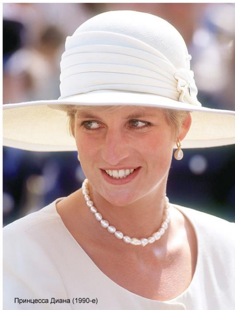
Принцесса Диана (1990-е)

требованиям протокола подобно многим другим представительницам британских аристократических семейств. Но только ей удалось сделать этот консервативный образ вновь актуальным. Это стало возможным благодаря нескольким причинам.