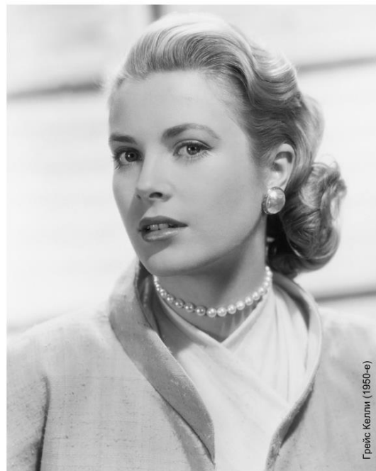
Грейс Келли (1950-е)

Кстати, маленький костюм Шанель коммерчески модным делают тоже американцы (парижане его поначалу вообще не заметили). Если бы не американские заказы и инвестиции, Дом Chanel могло