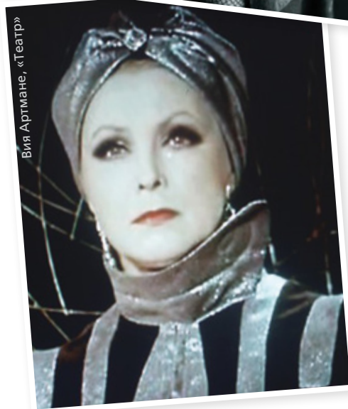
Вива Артмане, «Театр»

Имел ли в виду писатель Сару Бернар и многочисленных ее подражательниц? Пусть остается загадкой. Ведь дело вовсе не в этом. Мозг открыл главный парадоксальный секрет имиджа Diva: упомянутый образ создается не на театральной сцене и даже не в так называемой реальной жизни, а в иллюзорном мире сверкающих вспышек фоторепортеров. Великая актриса обречена на имидж Дивы. Либо ей остается превратиться в Сварливую Старуху. Третьего не дано.