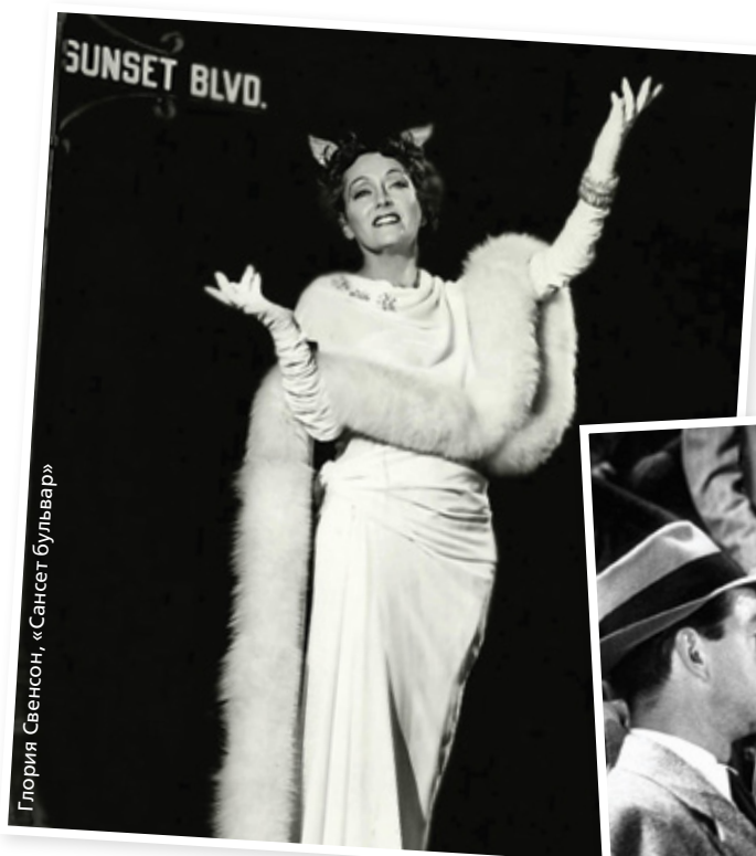
Глория Свенсон, «Сансет бульвар»

В комплекте с утрированным гримом и фантастическими нарядами от Эдит Хед, этот образ на долгие годы стал новой иконой Дивы XX века.