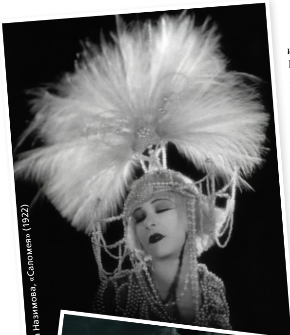
Алла Назимова, «Саломея» (1922)