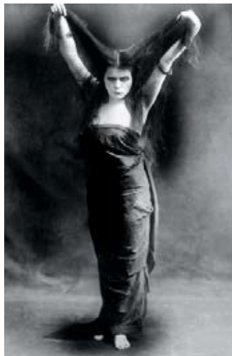
Teda Bēra — pirmā sievietes vampa imidža atveidotāja vēsturē — mēmajā kino „A Fool There Was”.