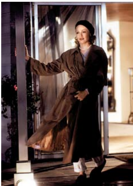
Arī Madonnas tēls filmā «Miesa kā pierādījums» ir mūsdienu stilizācija kulta imidžam Mis Slepenā aģente.

1997. gadā šim tēlam uzrodas jauns vārds — Nikita, kas nācis no amerikāņu un kanādiešu teleseriāla «La Femme Nikita». Starp citu, autortiesības pieder nevis kanādiešiem, bet franču režisoram Lukam Besonam, kas uzņēma savu filmu «Nikita» 1990. gadā. Tieši viņš palaida Visumā šo seno krievu vīrieša vārdu, kas tika dots sievietei, to aizņemoties no populārās Eltona Džona 80. gadu dziesmas.