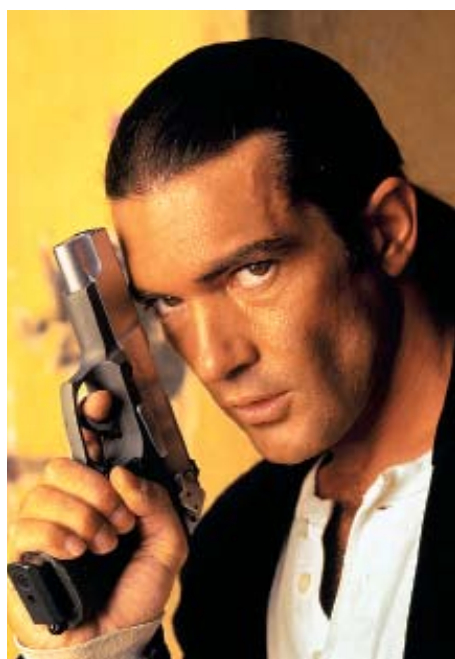
Antonio Banderasa atveidotā personāža imidžs filmā «Desperado» — mūsdienu mačo versija.

Tikai 20. gadsimta 70. gados mačo sāk pamazām atgriezties modē. Sākumā kā personāžs erotiskajā un pornoindustrijā, ģērbies kovboja, policista vai jūrnika tērpā. Pēc tam 1980. gadā tas ienāk kinematogrāfijā un šovbiznesā ar Adriāno Čelentāno, Lorenzo Lamasa, Džordža Maikla un it īpaši Fredija Merkūrija tēlu. Un visbeidzot mačo imidžs parādās arī vīriešu komercmodē: jaka «gaučo», kovboja zābaki, dziļi atpogāti krekli un ķieģelbrūns iedegums, trīsdienu rugāji un agresīva seksualitāte, tekila un muzikālie hiti latino stilā. Tūkstošiem «jaunizcepto» mačo parādās pilsētas ielās visā pasaulē. Taču pats galvenais — šis imidža notikums vēsturē bija vēl priekšā.