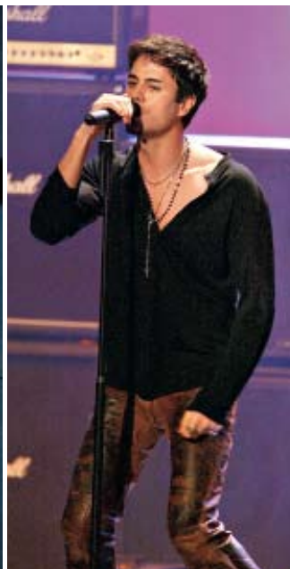
Šovbiznesā mačo imidžu izmantoja ne viens vien mūziķis — (no kreisās) Fredijs Merkūrijs, Džordžs Maikls un Enrike Iglešias, viens no mūsdienu sekssimboliem. Joprojām Enrike Iglešias neatstāj vienaldzīgu nevienu savu pielūdzēju.