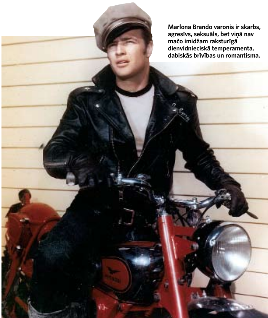
Marlona Brando varonis ir skarbs, agresīvs, seksuāls, bet viņā nav mačo imidžam raksturīgā dienvidnieciskā temperamenta, dabiskās brīvības un romantisma.

pārliecinoši nobīdot no pjedestāla melodramatiskā mīlnieka tēlu. Vai šis imidžs kļuva modīgs reālajā dzīvē? Tas atkarīgs no tā, ko uzskata par modi. Protams, līdz krūtīm atpogāti krekli, trīs dienu rugāji, meksikāņu iedegums tajā laikā vēl neparādījās Ņujorkas, Parīzes un Londonas ielās. Taču vesterna varoņu uzvedība izsauca atdarināšanas vilni, it īpaši gangsteru vidū.