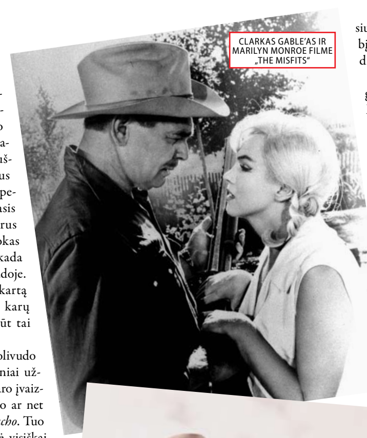
CLARKAS GABLE'AS IR MARILYN MONROE FILME „THE MISFITS“

Macho – kaubojus, nei labai gražus, nei elegantiškas, jis nedovanoja moterims gėlių ir nedaro žygdarbių vardan meilės, nes yra užimtas savo tikraisiais vyriškais reikalais. Jis griežtas ir mažakalbis, o bet kokį nesupratimą sprendžia kumščiais. Jo išvaizda – keistas nevalyvumo ir laukinio pižoniškumo derinys. Bendraudamas su moterimi tikrasis Macho apsieina su ilgo meilėnimosi ir nelaukia leidimo pabučiuoti. Pagrindinis jo bruožas – šiurkštus, beveik gyvuliškas seksualumas, kuriam negali atsispirti net ir nepriekaištinga ledi. O jeigu, praėjus 10 minučių nuo filmo pradžios, ji apdovanoja jį antau-