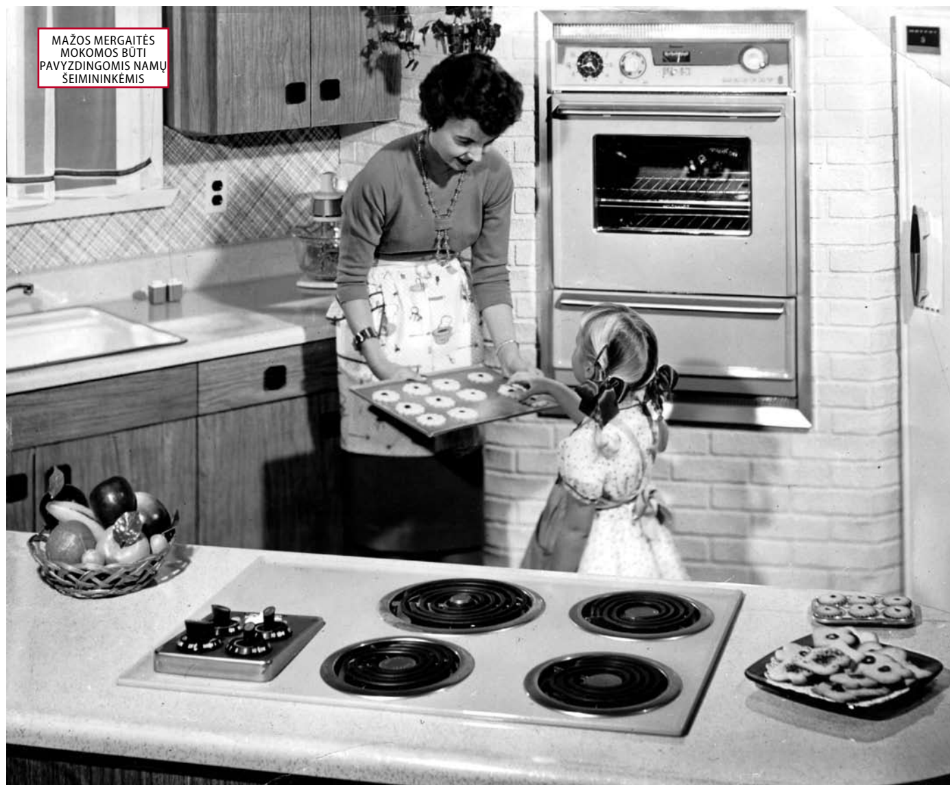
MAŽOS MERGAITĖS MOKOMOS BŪTI PAVYZDINGOMIS NAMŲ ŠEIMININKĖMIS

Šis vizualių bruožų rinkinys greitai tapo klasika: šaldytuvus, skalbimo miltelius ir