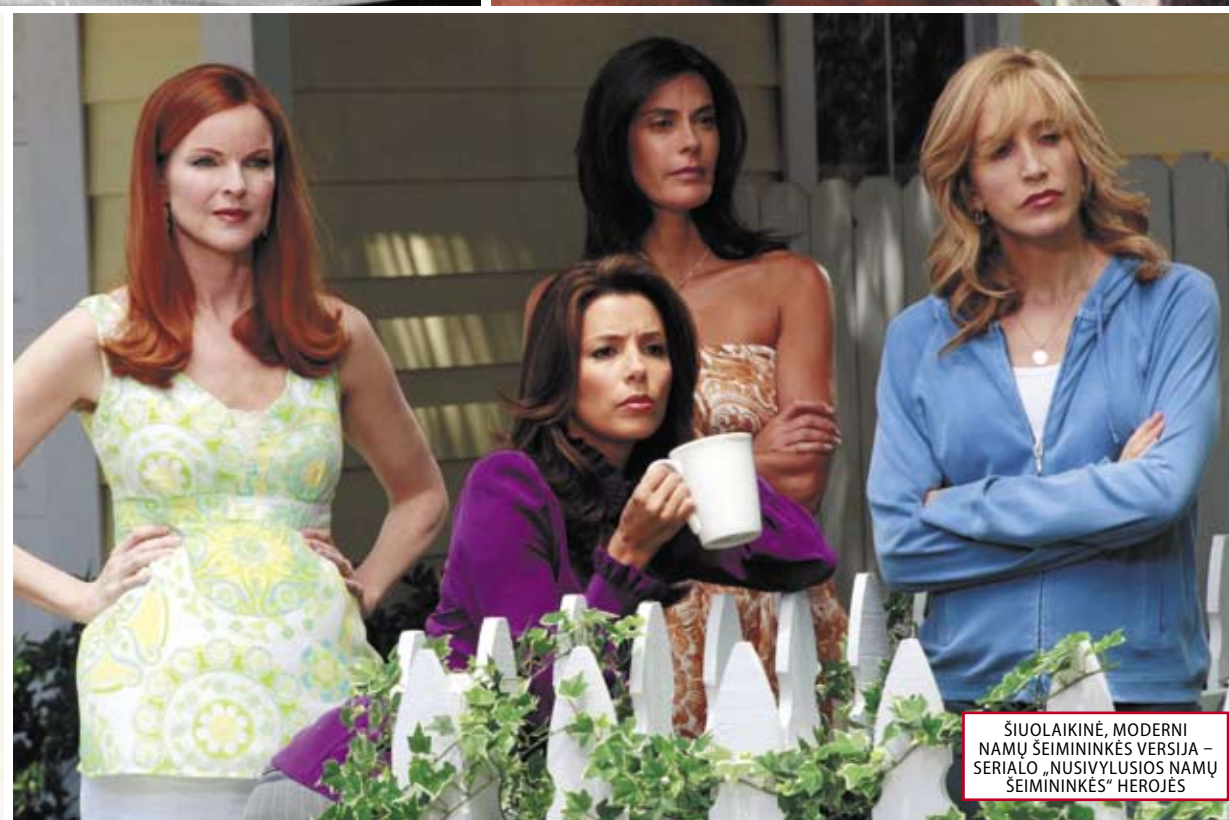
ŠIUOLAIKINĖ, MODERNI NAMŲ ŠEIMININKĖS VERSIJA – SERIALO „NUSIVYLUSIOS NAMŲ ŠEIMININKĖS“ HEROJĖS

viską, ko reikia namams, ėmė reklamuoti panašios viena į kitą saldžiai mielos damos idealiomis šukuosenomis ir sniego baltumo prijuostėmis, puostomis rankiniais, užrištomis ant languotų naminių suknelių. Jos visada geros nuotaikos, niekada nepavargsta ir nebūna paniurusios arba susimąščiusios. Nepriekaištingai išskalbti skalbiniai ir naujas virtuvės kombainas gali jas padaryti iš tikrųjų laimingas. Jų hobis – rankdarbiai ir gėlių auginimas, mėgstama literatūra – kulinarinės knygos ir prekių, pristatomų paštu, katalogai, o svarbiausias talentas – mokėjimas taupyti.