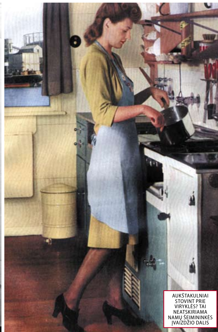
AUKŠTAKULNIAI STOVINT PRIE VIRYKLĖS? TAI NEATSKIRIAMA NAMŲ ŠEIMININKĖS IVAIZDŽIO DALIS