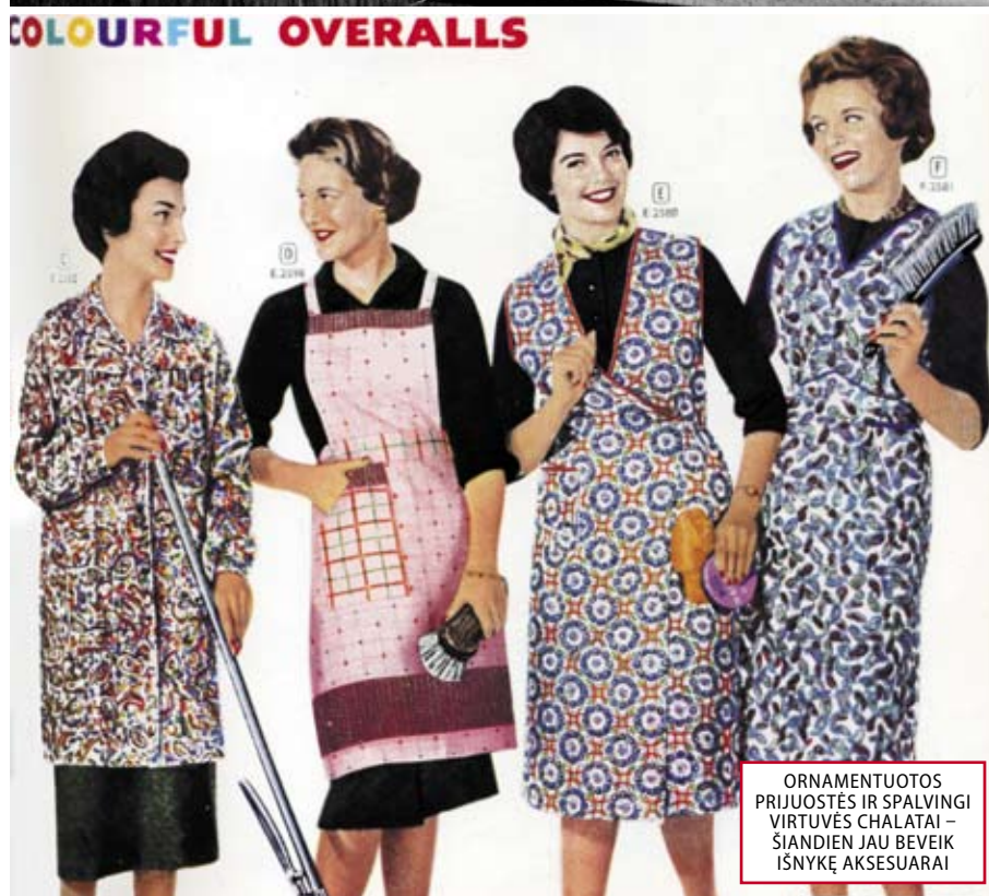
ORNAMENTUOTOS PRIJUOSTĖS IR SPALVINGI VIRTUVĖS CHALATAI – ŠIANDIEN JAU BEVEIK IŠNYKĘ AKSESUARAI